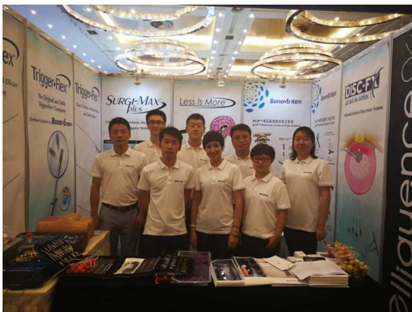
博能华公司 elliquence 销售团队